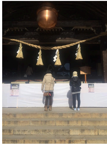
ケーブルカーチームは一定お先にお参りしました。