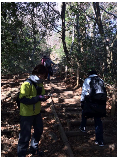
頂上付近で全員合流し、みんなで頂上を目指します。