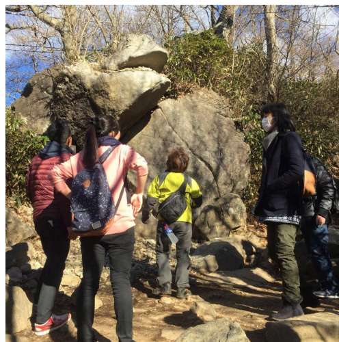
筑波山名物、ガマの岩。石を口に投げ込みます。