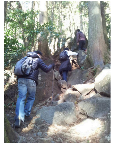
一方登山チーム。途中でだいぶ苦戦していた様子。