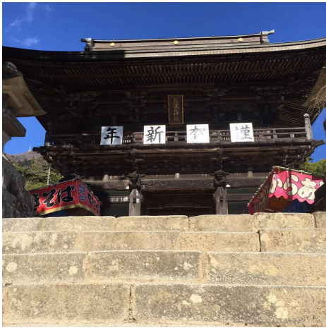
年末の筑波山は、なんと新年の準備の真っ只中！

2015年最後のプログラムは、毎年恒例の筑波山登山を行いました！！今年も、ケーブルカー組と登山組に2チームに分かれて登りました。今年はなんと登山組の方が人数が多く、みんな気合いを入れて登りました！最後の頂上までは、全員で登り恒例の記念撮影。頂上付近のお店でつくばうどんをみんなで食べて、帰りはみんなで景色を楽しみながらケーブルカーに乗りました。今年初めて登山にチャレンジした若者や、体力にも自信がついて迷わず登山組を選択する若者、また自分のキャパを見極めケーブルカーを選ぶ若者など、それぞれ自分で選択しての登山でした！今年もたくさんの方々のお陰で、キドックスも無事に一年を締める事ができました！！また来年もどうぞ宜しくお願いいたします！