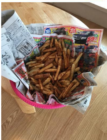
ポテトフライ完成！