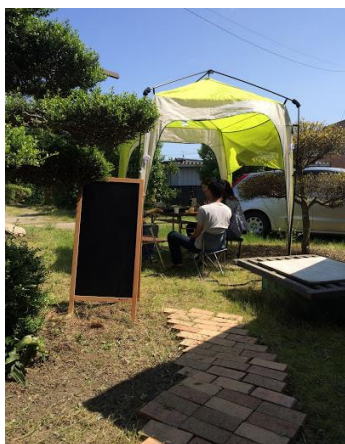
青空の下でランチ。