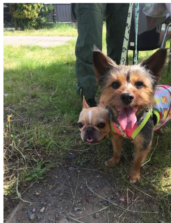
卒業犬の犬太くん！隣は先住犬のビーフくんです。