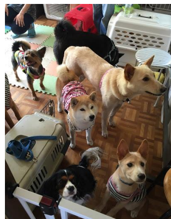
おやつを持つとアイドル気分です(笑)