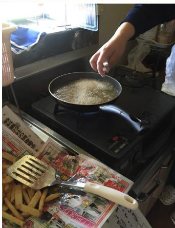
ポテトチームの様子。