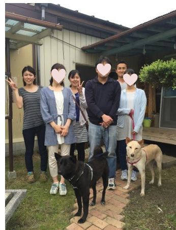
グリとグラと記念撮影！