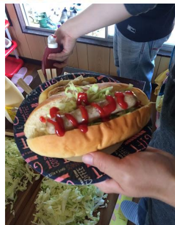
ホットドックにしました♪