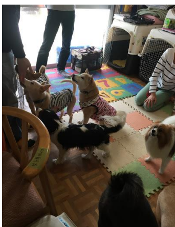
わんちゃんも皆で大交流！