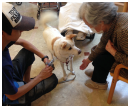
ぺ～もいつも通り楽しそうに活動に参加！ハンドラーの若者も会話が以前よりも多くなりました。