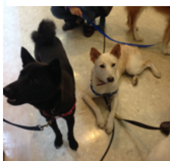
初参加のグリグラ兄妹！ どきどきどき…

さらに、今回の目玉は、シャイな双子の「グリとグラ」が訪問活動初デビュー！をしました！（といってもまだ場に慣れる練習中です…！）