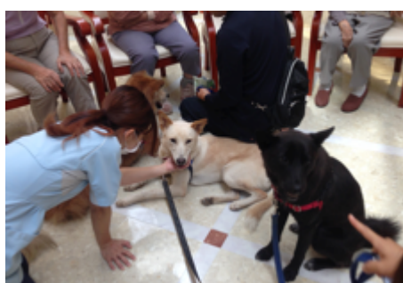
緊張しながらも、たくさんの人からおやつを食べることができました！