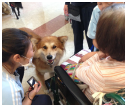
ポチはもう何度も訪問しているベテラン犬♪たくさんの人に可愛がられてウハウハ♪