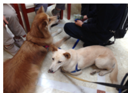
グラは、大好きなポチ先輩のそばにべったりでした。